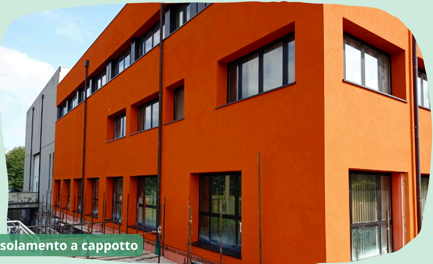
Isolamento a cappotto