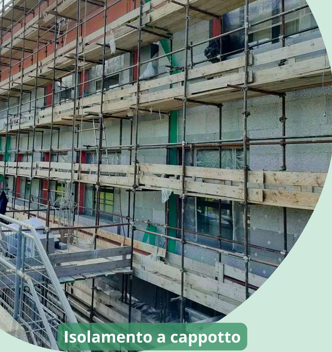
Isolamento a cappotto