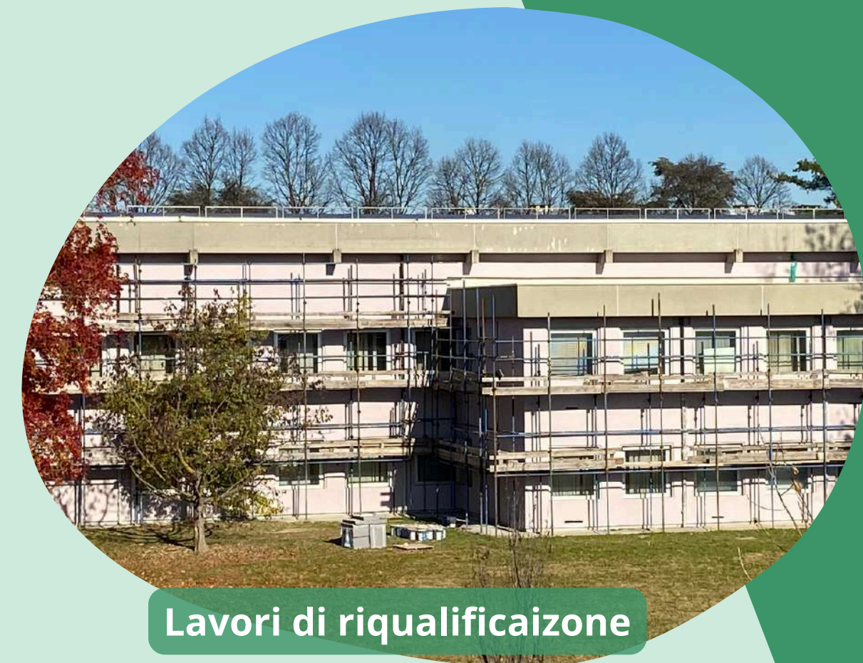
Lavori di riqualficazione